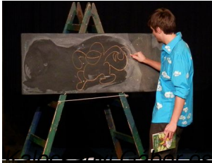
a Majom utazása