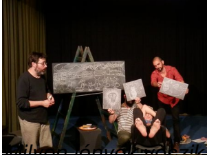
körül a Kéttalpú Embert?