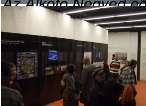
Az E-78 Várme-27 Hőifjúsági Ház kísérleti kiállítása, a Grand Pari(s) 2030