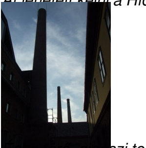
Előre látva turkász-tornyok