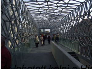
El lehetett képzelni a Hídon is, de a másik oldalon most nem volt idegenvezetés