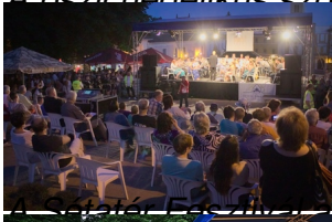
Magyarok Éjszakája - POSzT off-OFF programjaként szintén elrajtolt