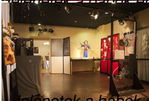
Telenetek a bábok életéből 2