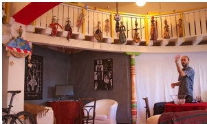
Telenetek a bábok életéből - Báb-el a MárkusZínházban