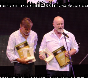
Levegőt a hand