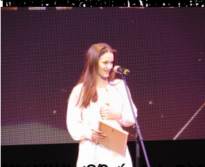
2019-es legjobb színpittor grafia: